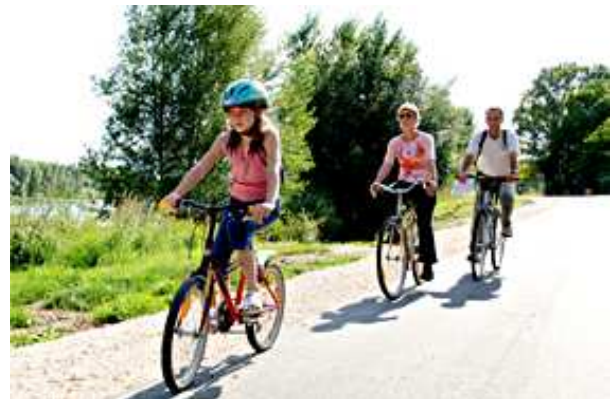
les châteaux à vélo - la Loire à vélo

Enfin c'est sur un futreau (embarcation traditionnelle à fond plat) que les marins d'eau douce pourront vivre au rythme de la Loire et accoster sur les grèves que découvre le fleuve. De même les bateaux-promenades de Montrichard ou de Saint-Aignan leur permettront de franchir les écluses de ce qui fut autrefois le Cher canalisé, à moins qu'ils ne préfèrent visiter Vendôme en barque, au fil du Loir.