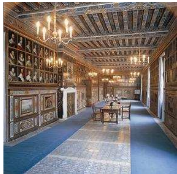
château de Beauregard – galerie des portraits

Plus au nord, la Commanderie d'Arville permet de revivre l'épopée des croisades. Au cœur de la Sologne, la parure de briques du château du Moulin se reflète dans l'eau de ses douves. Cette charmante demeure accueille désormais le conservatoire de la fraise. Enfin, tout au sud, sur les bords du Cher, à deux pas de Chenonceaux, s'élève la cité médiévale de Montrichard et son donjon.