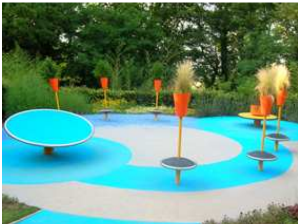
Festival international des jardins – Chaumont-sur-Loire

Sur les bords de Loire, la mémoire est vivante ; elle cultive l'avenir. Ainsi le Festival de Chaumont-sur-Loire (de la fin avril à la mi-octobre) est devenu « le » rendez-vous des amateurs de jardins. Cet événement de renommée internationale est désormais la référence en matière d'expression et de création contemporaine.