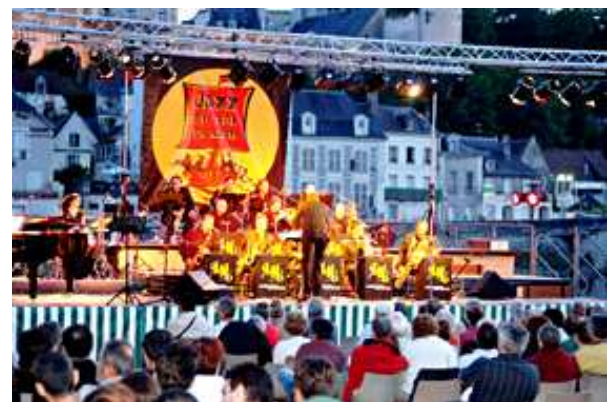
« Jazz en val de Cher »

Arrive ensuite l'été, le temps des festivals. Les amateurs de musique classique iront à Pontlevoy, ceux de jazz à Saint-Aignan (Jazz en val de Cher) ou à Salbris (Swing 41) et ceux de chansons contemporaines à Blois (Tous sur le pont).