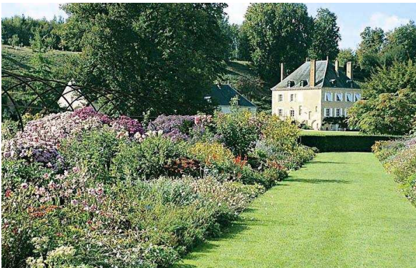
jardin du Plessis Sasnières

Prononcez le mot « jardin » et l'on vous répondra « festival » en référence au Festival International des Jardins de Chaumont. Cette manifestation ne saurait toutefois faire oublier les parcs et jardins qui fleurissent nos chemins tout au long de l'année. Une quinzaine de sites vous ouvrent leurs portes pour vous faire partager leur passion, celle de l'art du jardin. Si certains de ces jardins sont intimement liés aux châteaux qu'ils entourent (Beauregard, Cheverny...), d'autres mettent à l'honneur la création contemporaine (le Plessis-Sasnières, le Prieuré d'Orchaise).