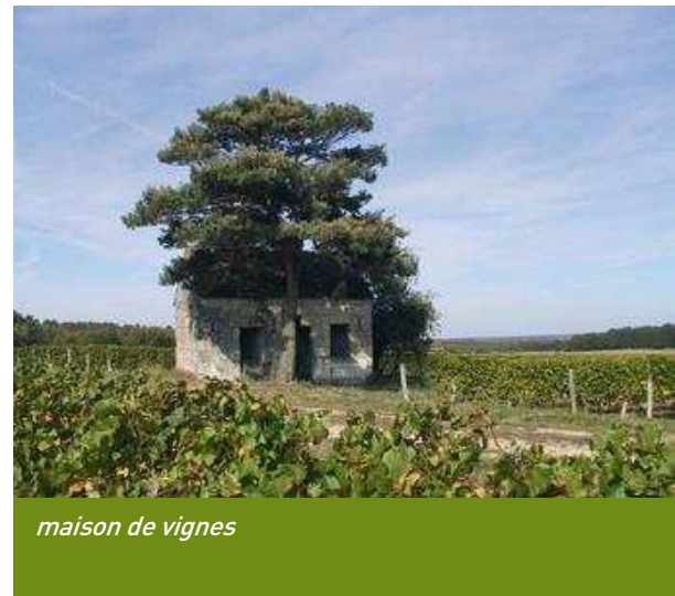
maison de vignes

Il convient ensuite de descendre jusqu'à Cheverny pour faire le tour des chais et goûter au « cour-cheverny », un vin blanc très particulier issu du romorantin, un cépage introduit par François I er en 1519.